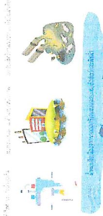
ใช้ปูนซีเมนต์สำหรับกันซึมตลอด